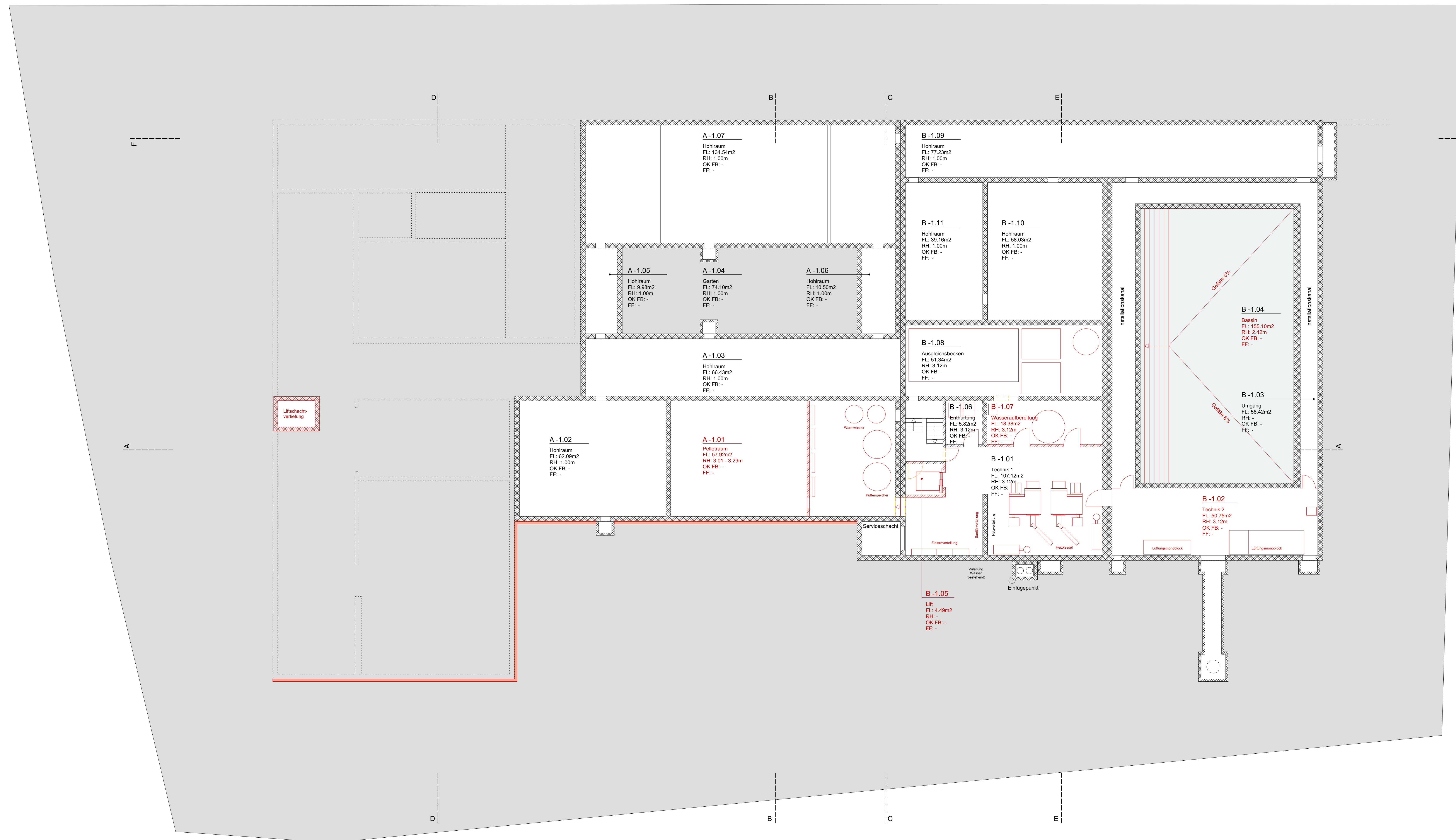
Schulhaus II – Klassentrakt A